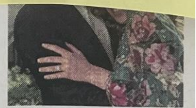
Beatrice und Edoardo Mapelli Mozzi brauchen Geduld.